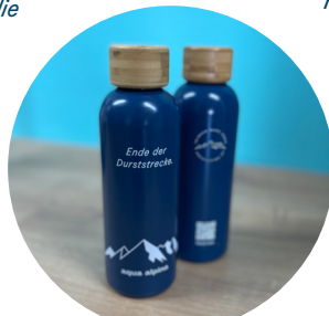
Trinkflasche aus Edelstahl

Füllvolumen 250ml Verkaufseinheiten: 600/2500 Stück