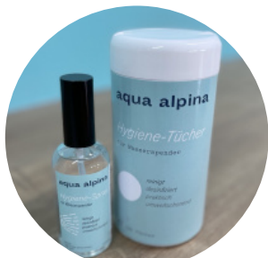
Hygienespray & Hygienetücher

Die aqua alpina Hygieneprodukte wurden speziell für die tägliche Reinigung von Wasserspendern entwickelt.